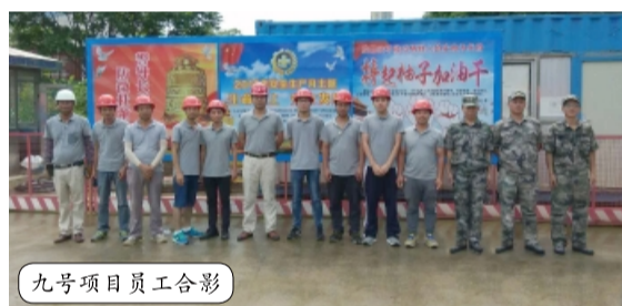
九号项目员工合影