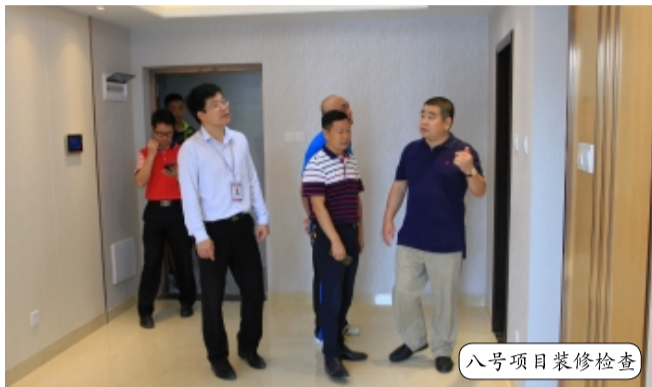
八号项目装修检查

在总结会上，品质检查小组表示，通过此次质量品质大检查，他们感受到项目的质量和管控能力有了明显提升，施工人员安全意识不断加强。同时，施工管理规范性、人员管理有效性都在不断提高。品质检查小组希望各项目部管理部门齐心协力，在保证安全的前提下抓好施工质量监督管理工作，为实现鹏广达集团精品梦想共同奋斗。