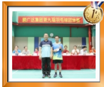
团体赛冠军：物业公司代表队