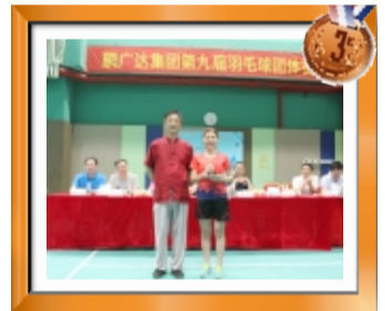
团体赛季军：集团本部代表队