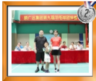
团体赛亚军：鹏广达地产代表队