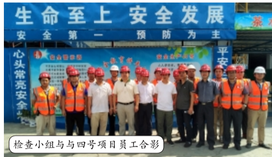
检查小组与四号项目员工合影