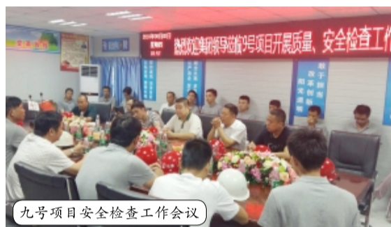
九号项目安全检查工作会议